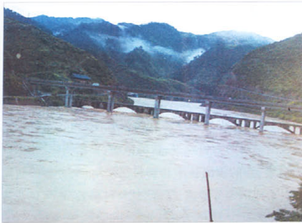
图 2 剑河县境内的清水江水位迅速上涨