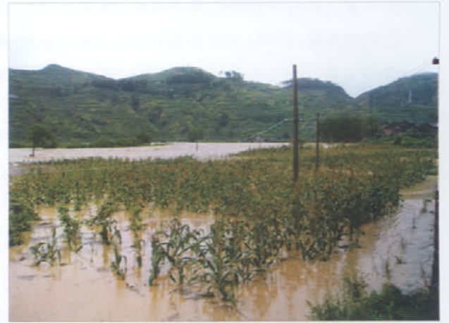
图 7 台江县大面积农田被洪水淹没

报道/贵州省黔东南州气象台 白 慧 梁 平