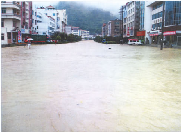
图 4 台江县城关出现大面积积水