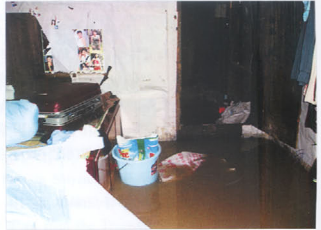
图 5 台江县居民房屋大量进水