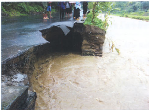
图 6 山洪暴发使雷山县境内公路被毁