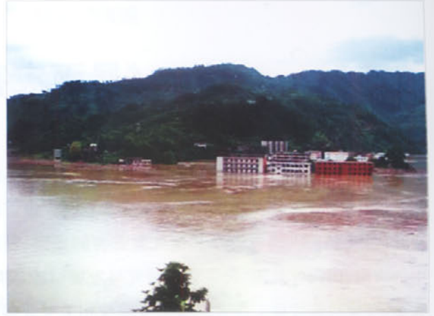
图 3 剑河县老城被淹没在一片汪洋之中