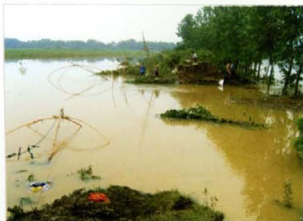
图 4 京山县白沙洲坝溃口处