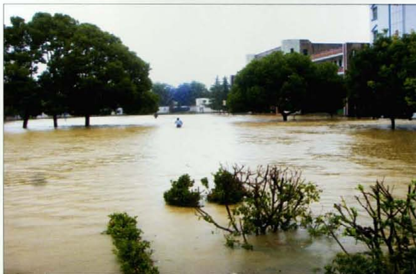
图3 暴雨后的京山县三阳镇街道

这次连续性暴雨天气过程给荆门市带来严重的洪涝灾害。全市受灾人口30.4万人,因灾死亡1人,伤病37人,农作物受灾67.1万亩,绝收20万亩,房屋受损14 563间,倒塌532间,紧急转移安置38 998人,直接经济损失1.8亿元。这次连续性暴雨过程伴有山洪、山体滑坡、洪水漫坝、水坝溃口、庄稼绝收等多种次生灾害(见灾情图片3~9)。