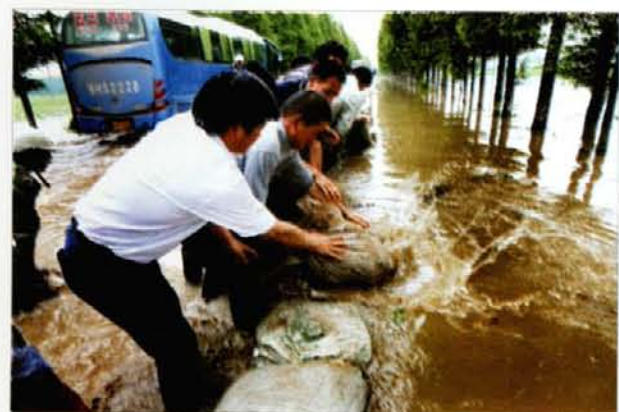
图 6 公路抢险