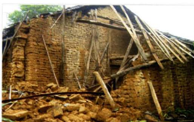
图 7 被暴雨毁坏的房屋