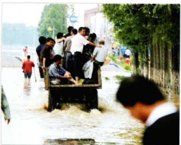
图 8 转移灾民