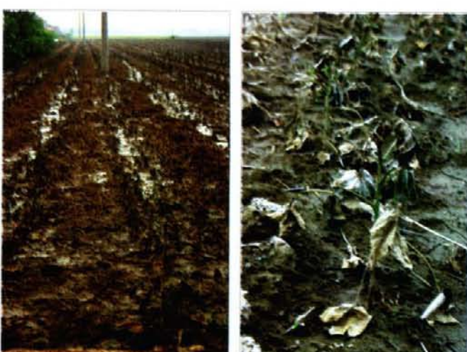
图 9 退水后的庄稼