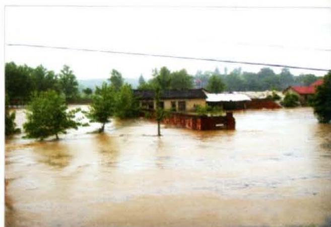
图 5 汪洋中的永隆镇陈桥村